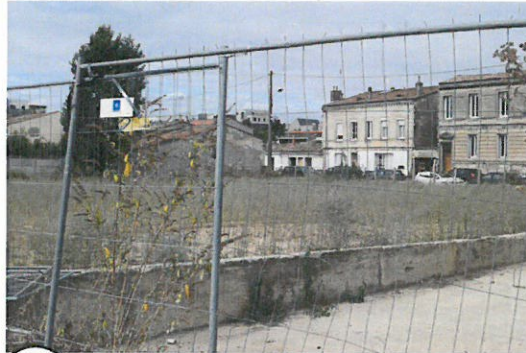
② Limite SREE Est rampe accès parcelle SB40