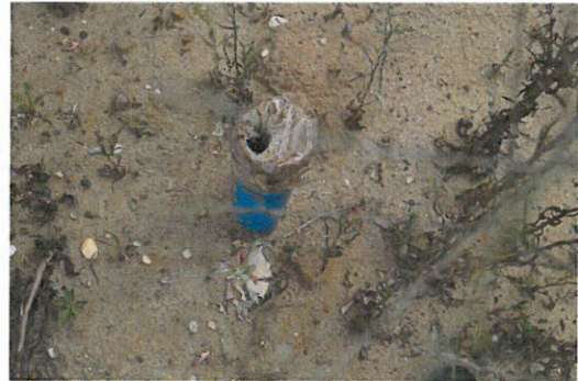
④ Piézomètre PZ15