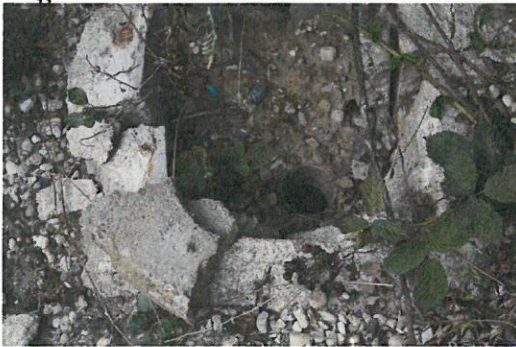
③ Piézomètre PZ5