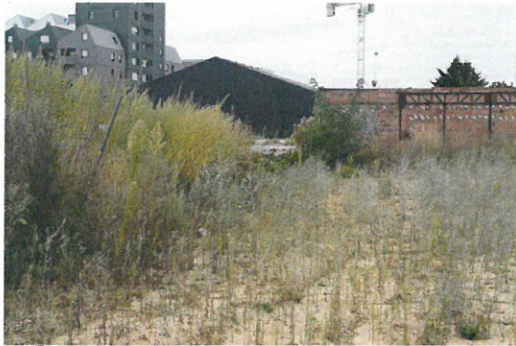
① Limite SREE Sud m